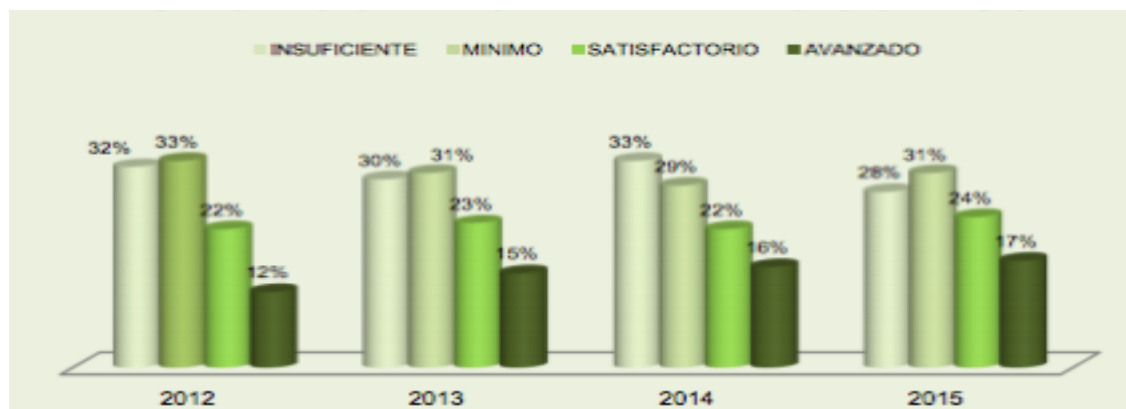
Gráfica 3: Medición resultados pruebas saber desde la implementación del programa PTA grado 5to.

Con relación a los resultados de años anteriores para el área del saber lenguaje se tiene resultados satisfactorios donde para el año 2012, un año después de haberse aplicado el programa fue del 31%, en el año inmediatamente siguiente se siguió manteniendo en 31%, para el año 2014 se disminuyó al 29% y para el año 2015 aumento a un 31%, mejorando en 2% en este último año. En conclusión, se ha venido mejorando, pero no es un crecimiento sostenido, especialmente en el año 2014 que bajo 2 puntos porcentuales.