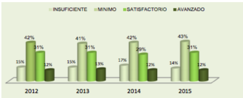
Gráfica 2 Medición resultados pruebas saber desde la implementación del programa PTA grado 5to