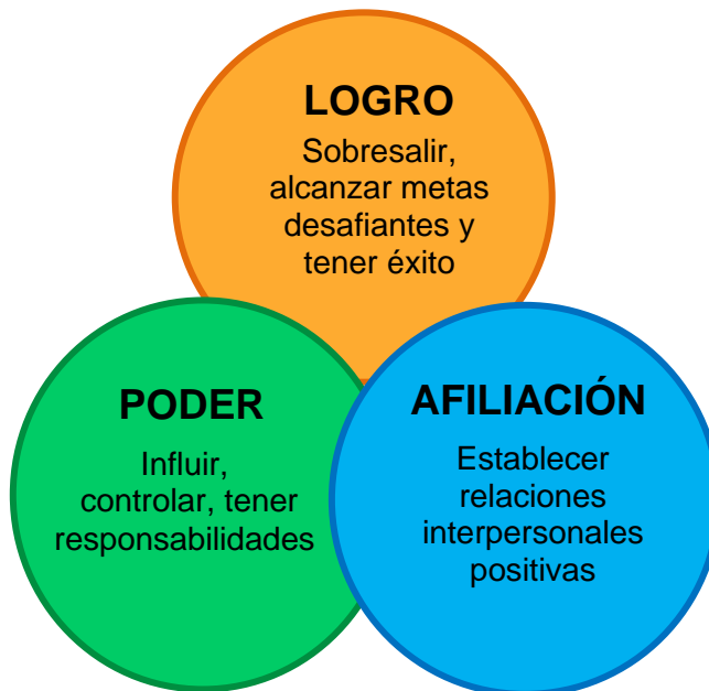
Teoría Motivacional de McClelland

Nota. La figura anterior describe como las tres necesidades están relacionadas y varían de una persona a otra y como la satisfacción de estas necesidades influye en la motivación y el comportamiento del individuo.