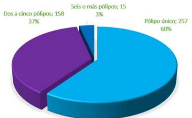
Gráfica 1: número de polipos por paciente

Al realizar un análisis bivariado para comparar las características demográficas con el tipo de riesgo del adenoma, no se encontraron diferencias en cuanto a edad y género. El promedio de edad de los pacientes con adenoma fue de 65 años (DS 13,6) y este promedio no se modificó al realizar la distinción por riesgo, la mediana (67 años) tampoco sufrió grandes modificaciones. La edad mínima de los pacientes de alto riesgo fue de 36 años y para los pacientes de bajo riesgo de 22 años. También se observó que a partir de los 45 años aumenta la proporción de adenomas, tanto de bajo como de alto riesgo. No se observaron diferencias